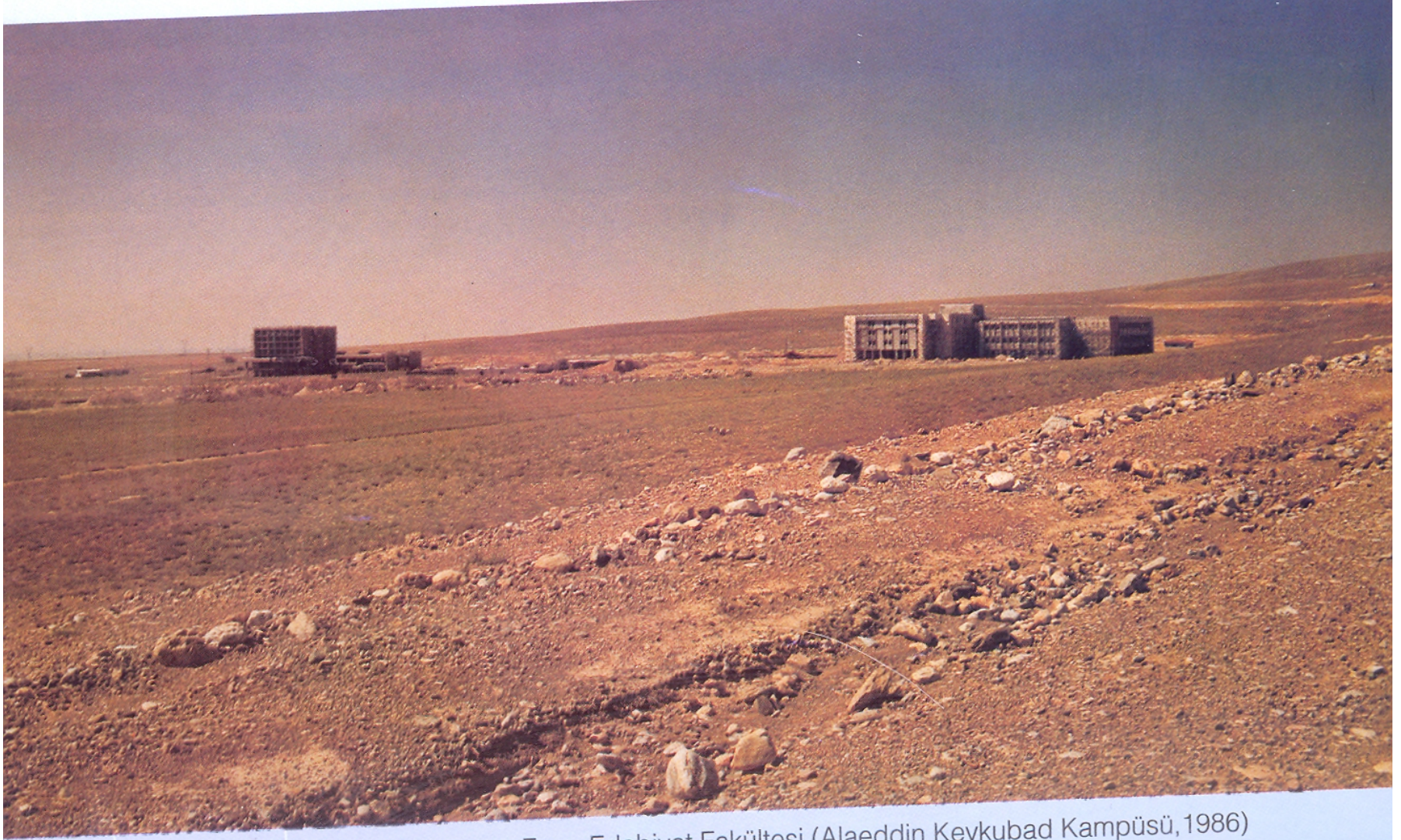
Alaeddin Keykubad Kampüsünde Rektörlük İdare Binası ve Fen - Edebiyat Fakültesi (Alaeddin Keykubad Kampüsü, 1986)