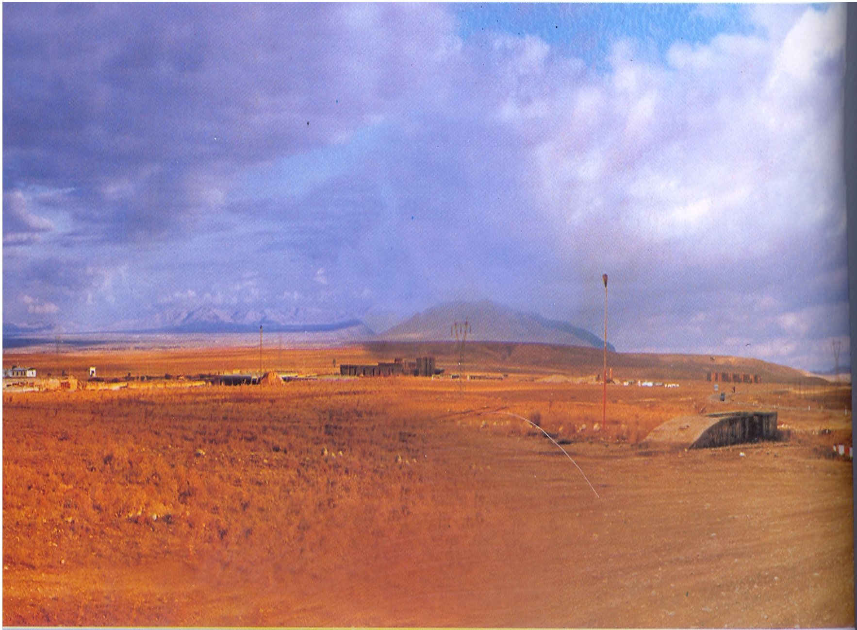
Alaeddin Kevkubad Kampüs Alanı