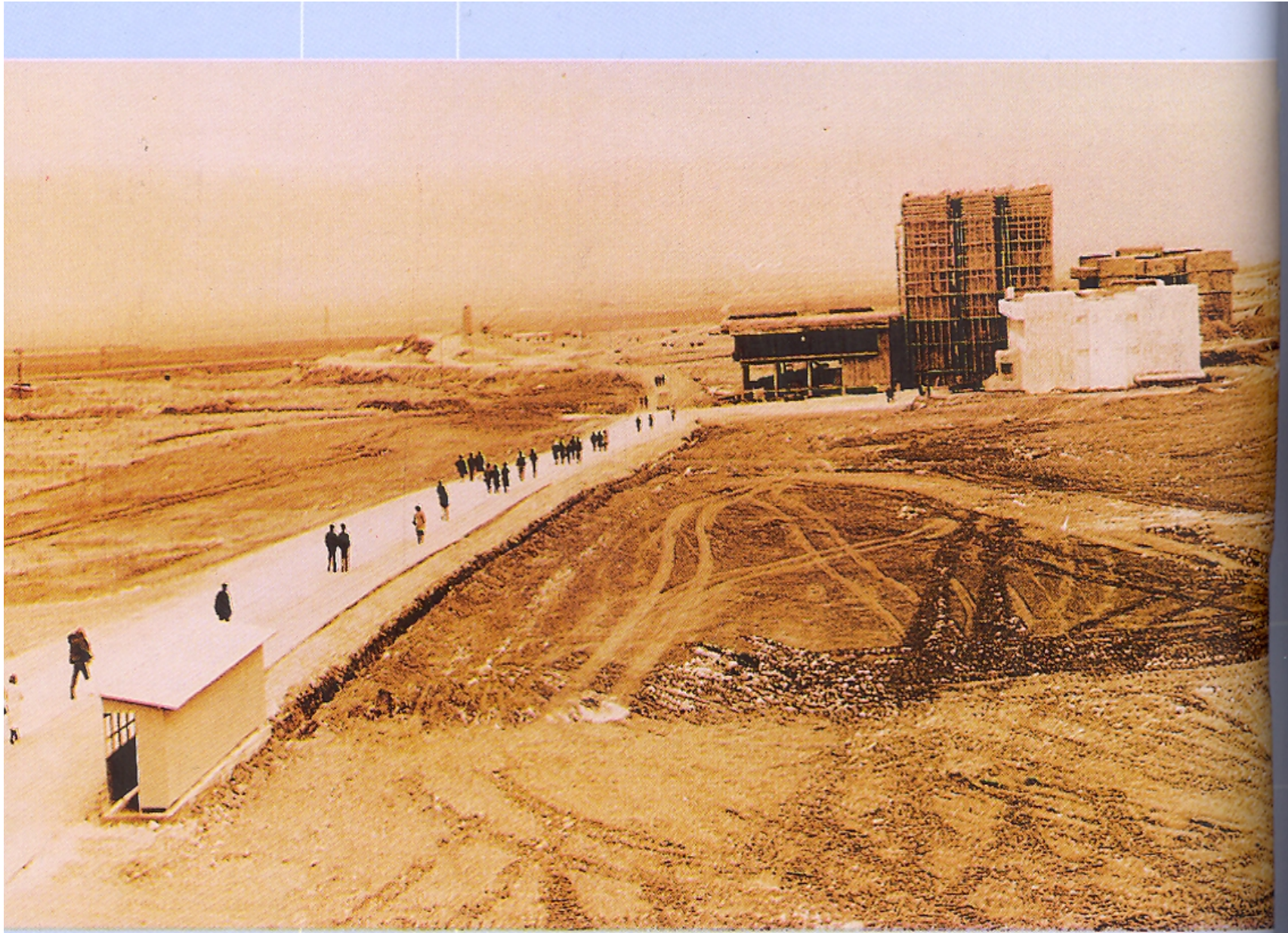
İnşaat halindeki Rektörlük İdare Binası, Makam Bloğu, Konservatuvar